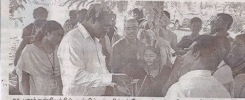
தா. பழர் ஒன்றியத்தில் அன்பில் தம்மலிங்கம் வேளாண் கல்லூரி மாணவிகளின் சாப்பில் நடைபெற்ற நிலக்கடலை முன்பருவ சாகுபடி முகாமில் விவசாயிகளுக்கு விளக்கமளிக்கும் மாணவிகள்.

அரியலூர், ஆக.10 அரியலூர் மாவட்டம், தா. பழர் ஒன்றியத்தில் நிலக்கடலை முன்பருவ சாகுபடி முகாம் அண்மையில் நடைபெற்றது.