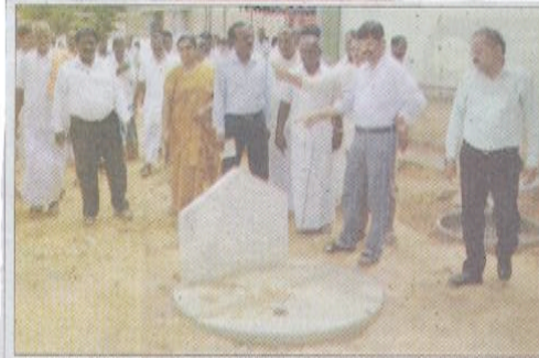
தா.பழநி ஒன்றிய அலுவலக வளாகத்தில் அமைக்கப்பட்டுள்ள புதிய மழைநீர் சேமிப்பு தொட்டியை கலெக்டர் சரவணவேல்ராஜ் பார்வையிட்டு ஆய்வு செய்தபோது எடுத்த படம்.